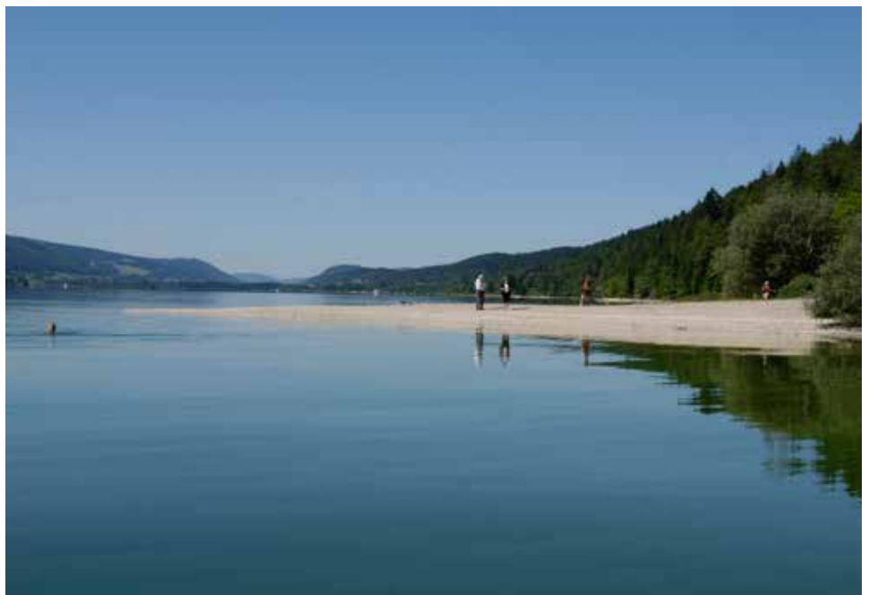
Bild oben: Vom Dent de Vaulion geniesst man eine atemberaubende Aussicht über das gesamte Vallée de Joux. Bild unten: Die zahlreichen, vom Uferwald umwachsenen Buchten laden zum erfrischenden Bad im Lac de Joux.

ner Steg über das von Schilf bewachsene Hochmoor, umrundet den gesamten See. Und führt über kurze Abzweige immer wieder zu kleinen Buchten, in denen es sich baden lässt im kühlen, perlend klaren See-wasser.