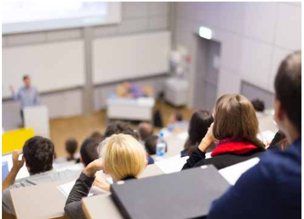
Das 20. Jubiläum des Instituts für Komplementärmedizin an der Universität Bern wurde mit einem vielseitigen Symposium zur Entwicklung des Fachbereiches begangen.