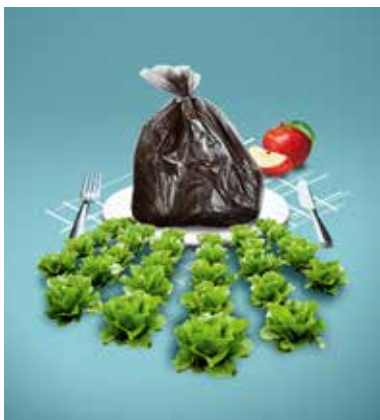
Les promenades à thème sur le gaspillage alimentaire vous conduisent au cœur de l'action.

En Suisse, environ 120 kg de denrées alimentaires par personne et par an finissent inutilement à la poubelle. Lors des promenades à thème organisées à Olten, Saint-Gall et Zurich, nos spécialistes vous emmènent en docte compagnie à la découverte de projets qui ont déclaré la guerre au gaspillage alimentaire.