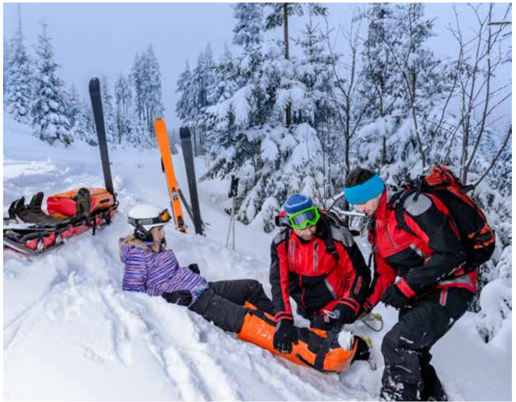
La plupart des accidents qui se produisent sur les pistes de ski sont des accidents individuels.

le cadre de cette assurance complémentaire les frais de transport d'urgence à concurrence de 100 000 francs et vous fait bénéficier d'une assistance. EGK propose en outre des assurances-voyage qui prennent en charge les situations d'urgence et de sauvetage ainsi qu'un éventuel rapatriement en Suisse.