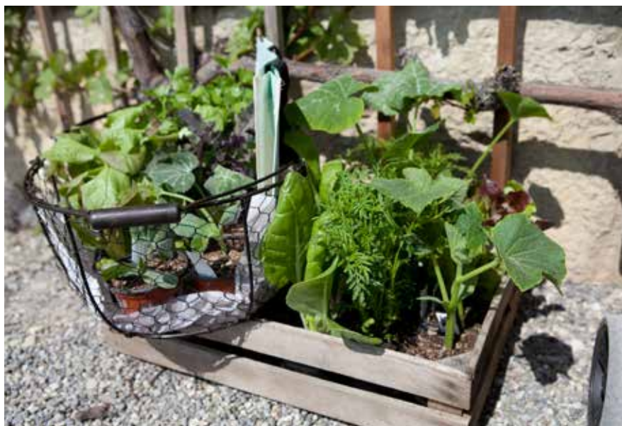
Les douze marchés de plantons de ProSpecieRara accueillent chaque printemps les amoureux des plantes et des jardins.

charme: «Des personnes de tous horizons se réunissent autour de pizzas cuites au four en argile, de crêpes ou de glaces faites à la ferme: de la représentante du parti écolo à la manager en passant par le jeune hipster urbain. Ainsi germe l'espoir de voir à nouveau pousser les belles plantes un peu partout», affirme N. Egloff l'air réjoui. Plusieurs possibilités s'offrent à ceux qui veulent s'impliquer concrètement en faveur de la plus grande diversité possible de nos menus, par exemple en devenant cultivatrice ou cultivateur.