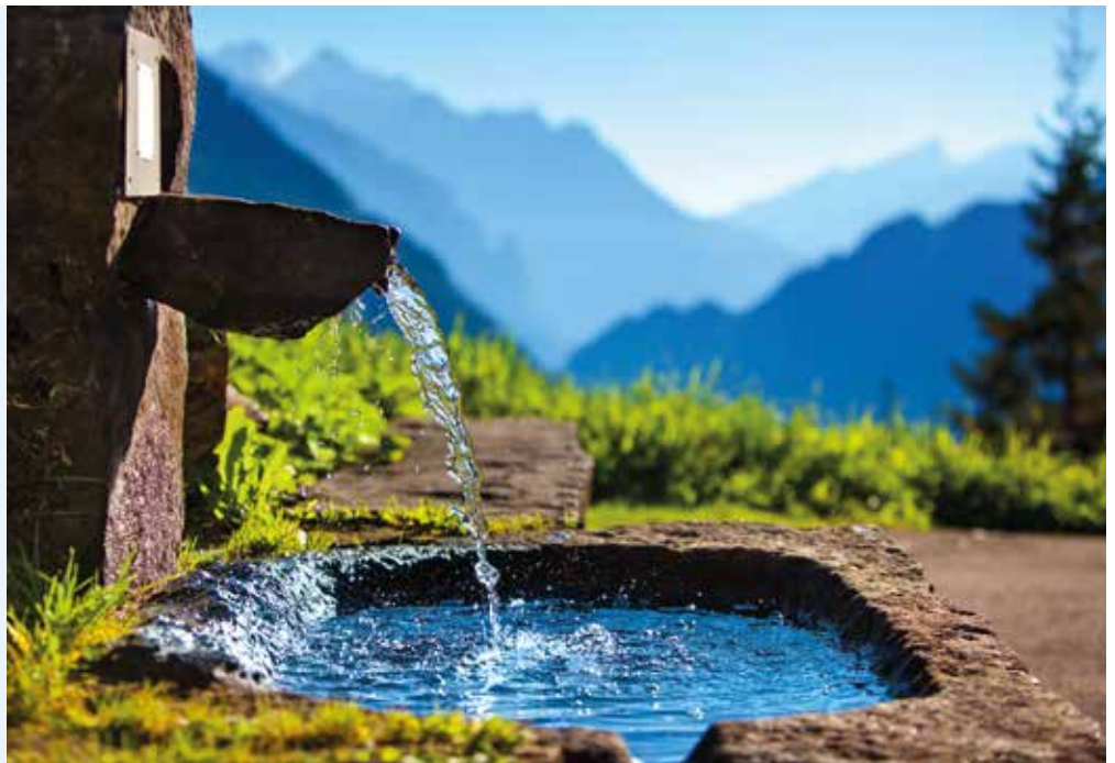
Les substances toxiques présentes dans l'air ou dans l'eau ont un impact sur notre santé.