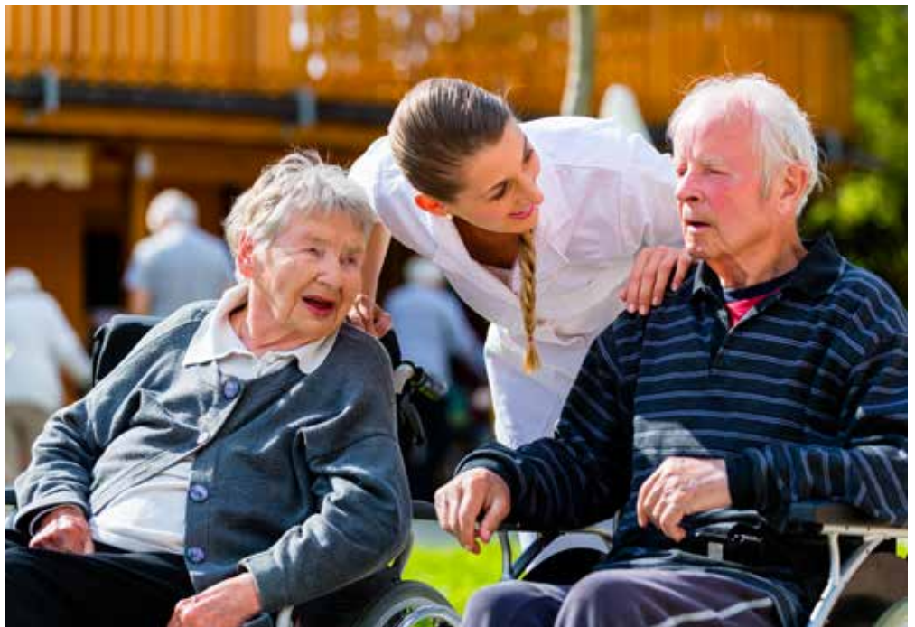
Dans 20 ans, dix pour cent de la population suisse aura plus de 80 ans.

acceptable d'un point de vue libéral», avance l'économiste. Reste à savoir si un tel système pourrait effectivement trouver un large ancrage dans la population ou si ce sont plutôt les plus hauts revenus qui y auraient accès dans une optique d'optimisation fiscale.