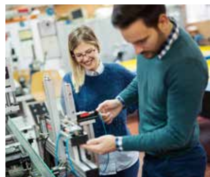
En l'absence de nouvelles solutions de financement des soins de longue durée, le problème sera reporté sur les jeunes qui viennent d'entrer dans la vie active.