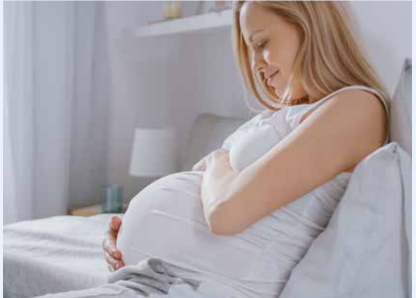
Les médicaments homéopathiques peuvent être très utiles avant, pendant et après l'accouchement.

siques. Savoir observer pour décider est primordial.»